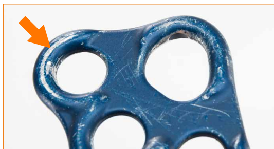
FOTO APÉNDICE PLACAS MULTIANCLAJES